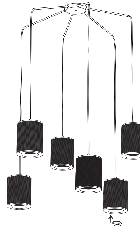
Tabela / Tabla / Table

ATENÇÃO: os cabos são de tecido, manuseie-os com cuidado para não danificá-los