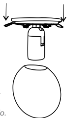
Tabela / Tabla / Table

To remove the glass, tilt it to one side, this will flex the metal rod located inside the sphere and will allow the removal of the glass.